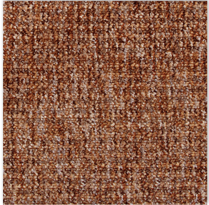
82 4m + 5m