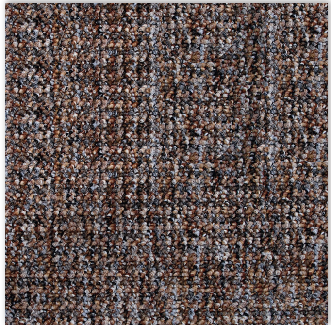
42 4m + 5m

Firma Associated Weavers zastrzega sobie prawo do zmiany właściwości tego produktu przy zachowaniu tych samych właściwości technicznych. Zdecydowanie zalecamy stosowanie ciemniejszych kolorów w obszarach o dużym natężeniu ruchu.