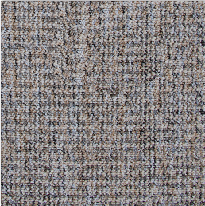
39 4m + 5m